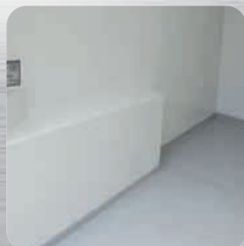
Plancher antidérapant avec caissons de passages de roues