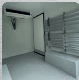
Aménagement intérieur personnalisable (en option)