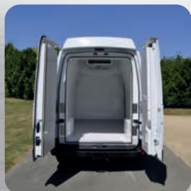
Isolation des ouvrants d'origine par des contre-portes isothermes