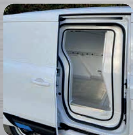
Accès porte latérale coulissante droite préservé