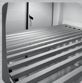
Plancher intermédiaire amovible à clayettes (en option)