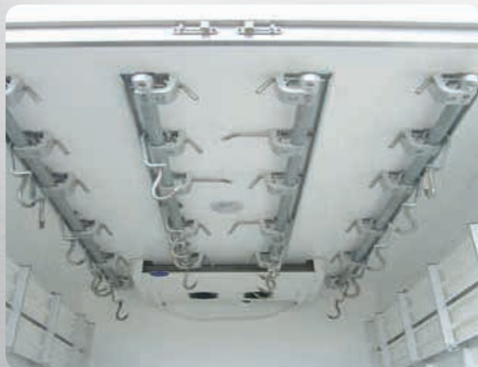
Penderie porte viandes en rail tubulaire

LAMBERT Constructeur, c'est 45 ans d'expérience dans les métiers du transport et de la distribution de viandes.