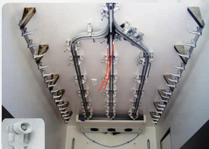
Réseau aérien 3 voies et barres à viandes