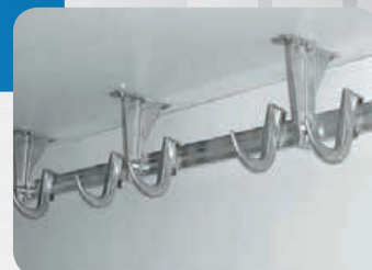
Barres à viandes et crochets profonds N°2