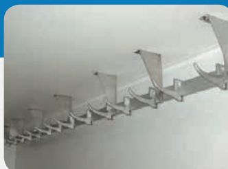
Barres à viandes et crochets dent de loup N°1