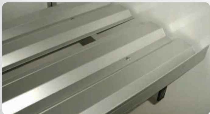
Etagère aluminium anodisé, plateau standard

L'aluminium anodisé permet une meilleure longévité de sa surface (aucune corrosion ou altération de couleur).