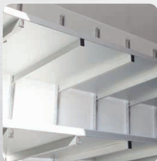
Plateaux tôle pleine