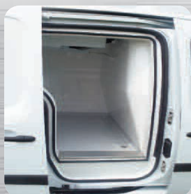
Porte latérale coulissante droite isolée en option