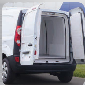
Isolation des ouvrants d'origine par des contre-portes isothermes

Étagères aluminium anodisé / Rails et sangles d'arrimage / Plancher intermédiaire / Barres à viandes / Seuil poissonnier / Rideau à lanières / Attelage de remorque / Ouverture(s) latérale(s)