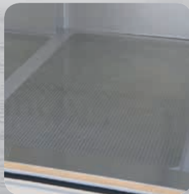
Plancher renforcé aluminium (en option)