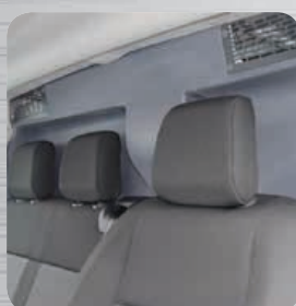
Ouïes de décompression obligatoires et conforme aux exigences constructeurs.