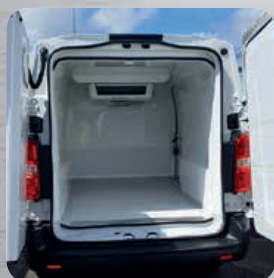
Plancher antidérapant avec passage de roues