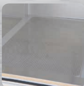
Plancher renforcé aluminium en option.