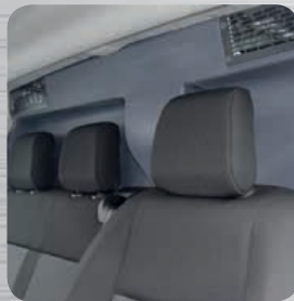
Quils de décompression obligatoires et conformes aux exigences constructeurs