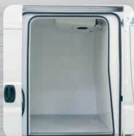
Porte latérale coulissante isolée (en option)