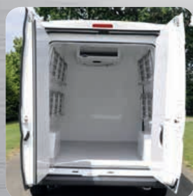
Plancher anti-dérapant avec caissons de passage de roues et étagères relevables (en option)