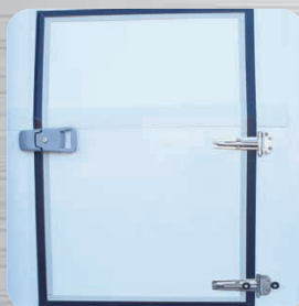
Porte latérale battante isolée en option