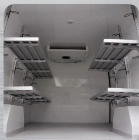
Etagères sur les côtés en option