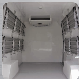
Plancher antidérapant avec passage de roues