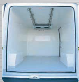
Barre à viande inox (en option)