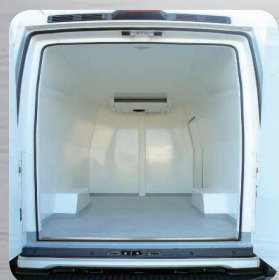
Plancher anti-dérapant avec passage de roues