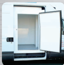
Option porte latérale battante droite