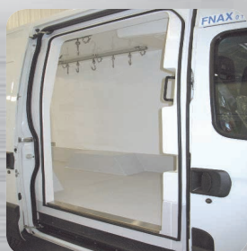
Porte latérale coulissante et option barres à viande