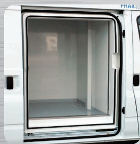
Isolation de la porte latérale coulissante