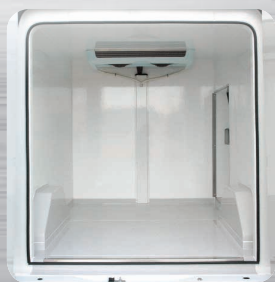
Plancher antidérapant avec passage de roues