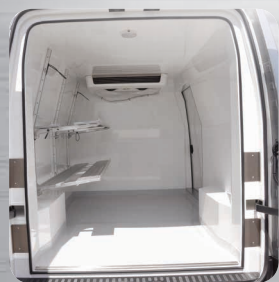
Etagères fixes ou relevables en option