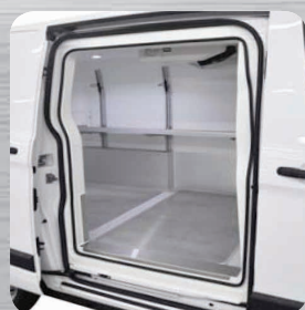
Porte latérale d'origine isolée