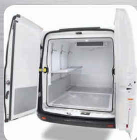
Etagères fixes ou relevables en option