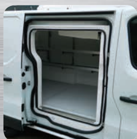
Contre-porte isotherme fixée sur la porte latérale d'origine