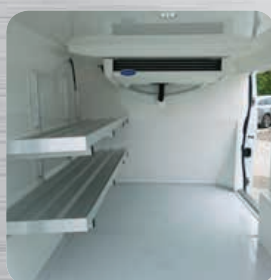
Nombreuses options personnalisées