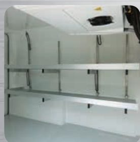
Plancher antidérapant avec passage de roues et étagères relevables