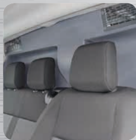
Quies de décompression obligatoires et conforme aux exigences constructeurs.