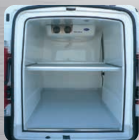
Plancher antidérapant avec passage de roues et plancher intermédiaire