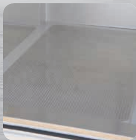
Plancher renforcé aluminium en option.