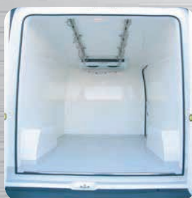
Barre à viande inox en option