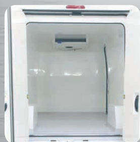
Plancher anti-dérapant avec caissons de passage de roues