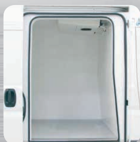
Porte latérale coulissante isolée en option